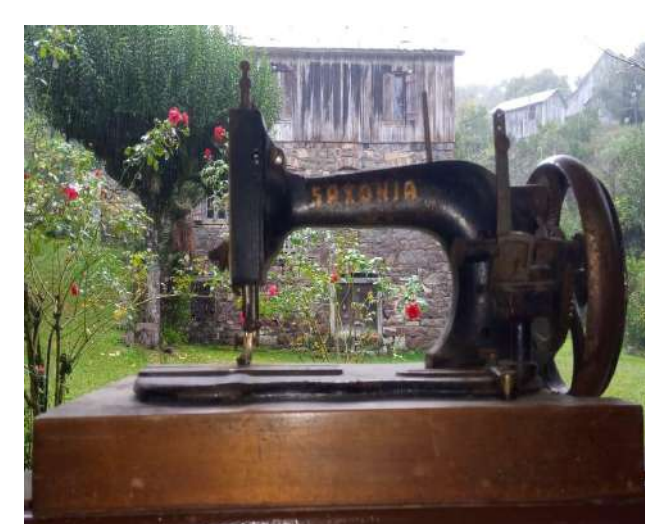
Figura 4: Máquina de costura da família